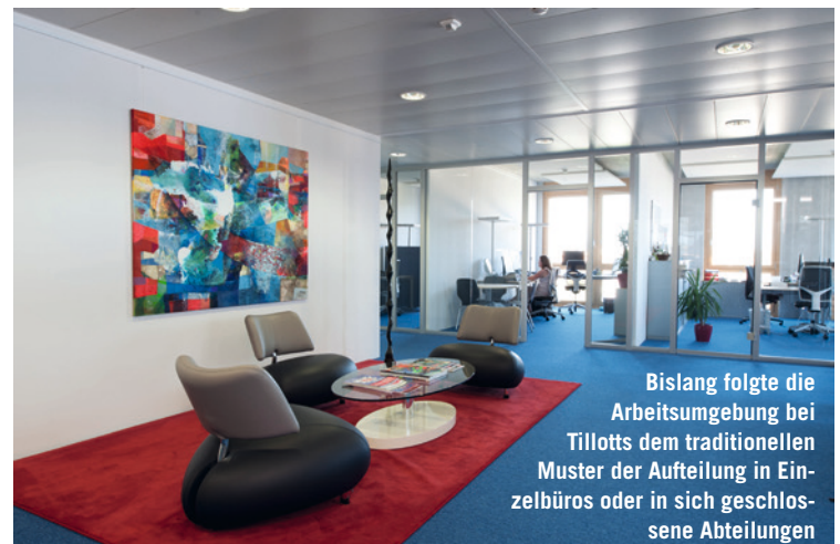
Bislang folgte die Arbeitsumgebung bei Tillotts dem traditionellen Muster der Aufteilung in Einzelbüros oder in sich geschlossene Abteilungen